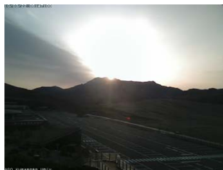
2010/03/22 6:47 6:12