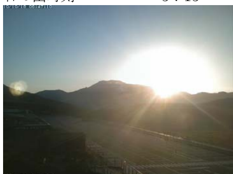
撮影時刻 2010/10/18 6:47 日の出時刻 6:16