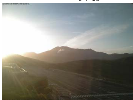
2010/05/21 5:38 5:07