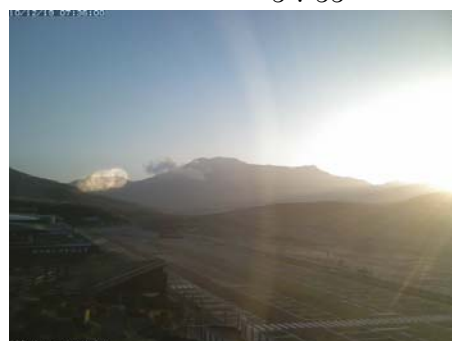
2010/12/19 7:36 7:07