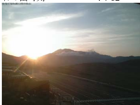
撮影時刻 2010/04/17 6:03 日の出時刻 5:39