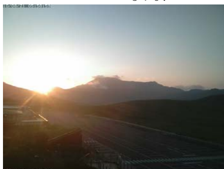
2010/08/21 5:59 5:37