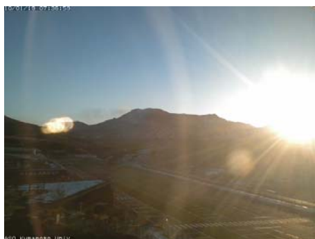
撮影時刻 2010/01/19 7:37 日の出時刻 7:12