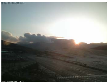
2010/02/21 7:12 6:48