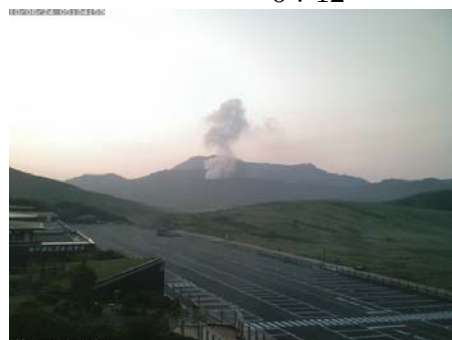
2010/06/24 5:35 5:02