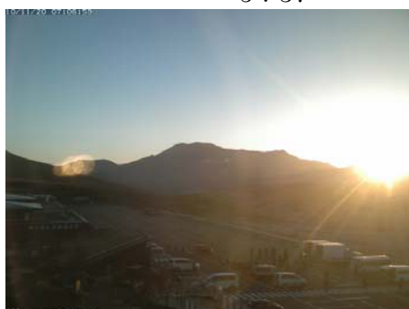
2010/11/20 7:07 6:44